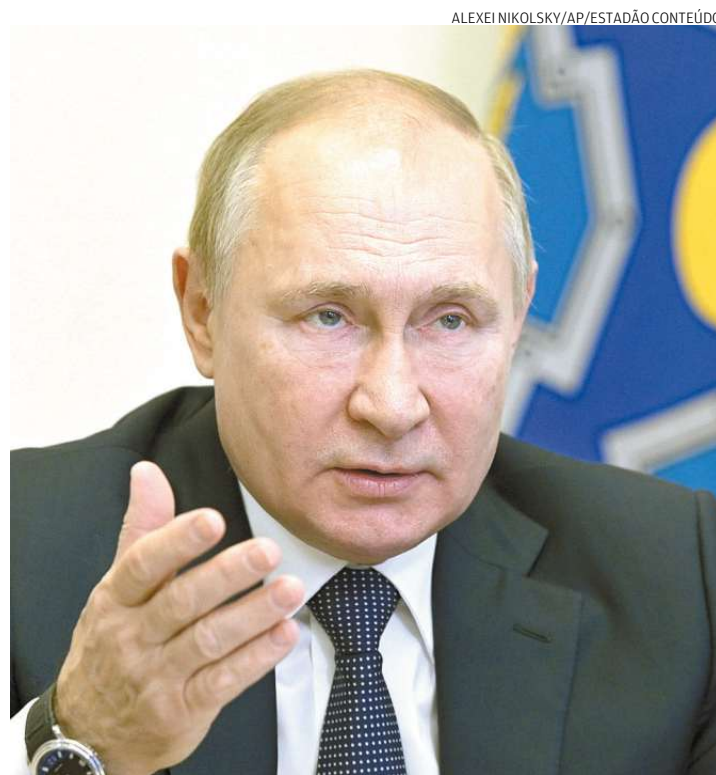
GOVERNO PUTIN CONTA COM NAVIOS ARMADOS COM MÍSSIL HIPERSÔNICO

Expressando preocupação de que a Otan possa usar o território ucraniano para a implementação de mísseis capazes de atingir Moscou, o presidente Vladimir Putin observou que navios russos armados com o mais recente míssil de cruzeiro hipersônico Zircon dariam à Rússia uma capacidade semelhante se posicionados em águas neutras. (Estadão Conteúdo)